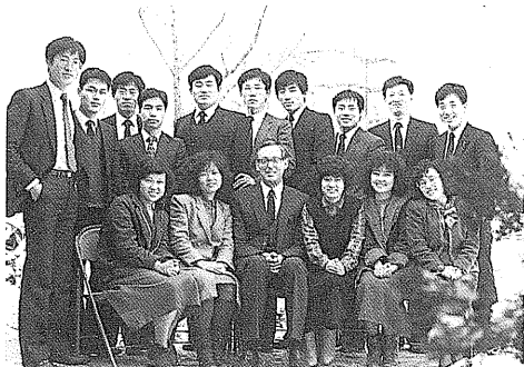
성도의 빛/1985년 6월호