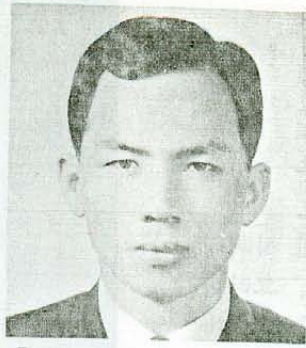
천 낙서 형제 신촌 지부장으로